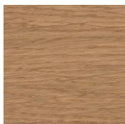
3028 Бесцветное шелковисто- матовое