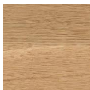
3058 Бесцветное матовое