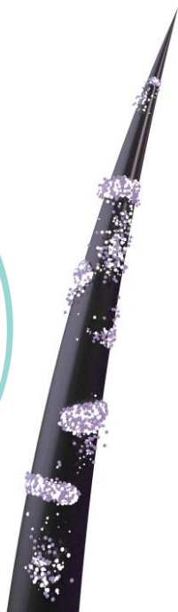
Классическое ламинирование ресниц