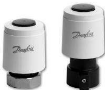
Рис. 1. Общий вид термоэлектрического привода типа TWA

Приводы термоэлектрические типа TWA предназначены для двухпозиционного управления различными регулирующими клапанами в системах отопления и охлаждения с фэнкойлами, а также в небольших местных вентиляционных установках.