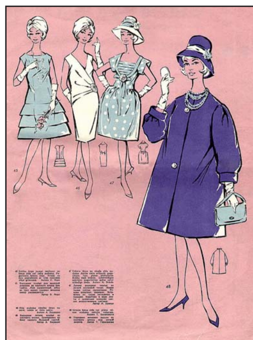
105б. Модели сезона, № 7. 1960, с. 11