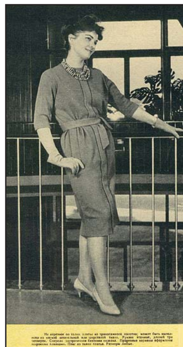
105а. Международный конгресс мод. Москва, 1961, с. 44

натуральные. Например, шуба из синтетического меха была значительно более модной, чем какой-нибудь каракуль. Широкие бусы из многочисленных нитей очень хорошо выглядели не только на обнаженной шее, но и на вошедших в это время в моду водолазках, а к летним платьям девушки охотно надевали изящные колье,