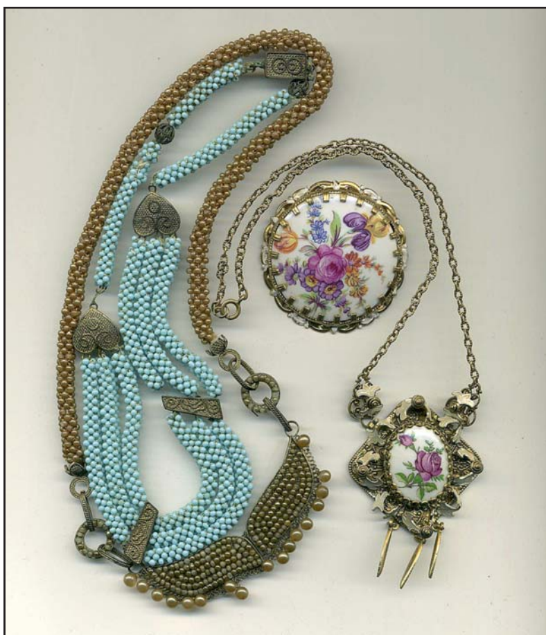
102. Подвеска. Фарфор, металл, эмаль. Деколь. Замок-карабин круглый. Длина 48. Германия. 1950-1960-е гг. (?)

Брошь фарфоровая. Деколь с ручной «доводкой», металл, эмаль. Диаметр 5,5. Чехословакия или Германия. 1950-1960-е гг.