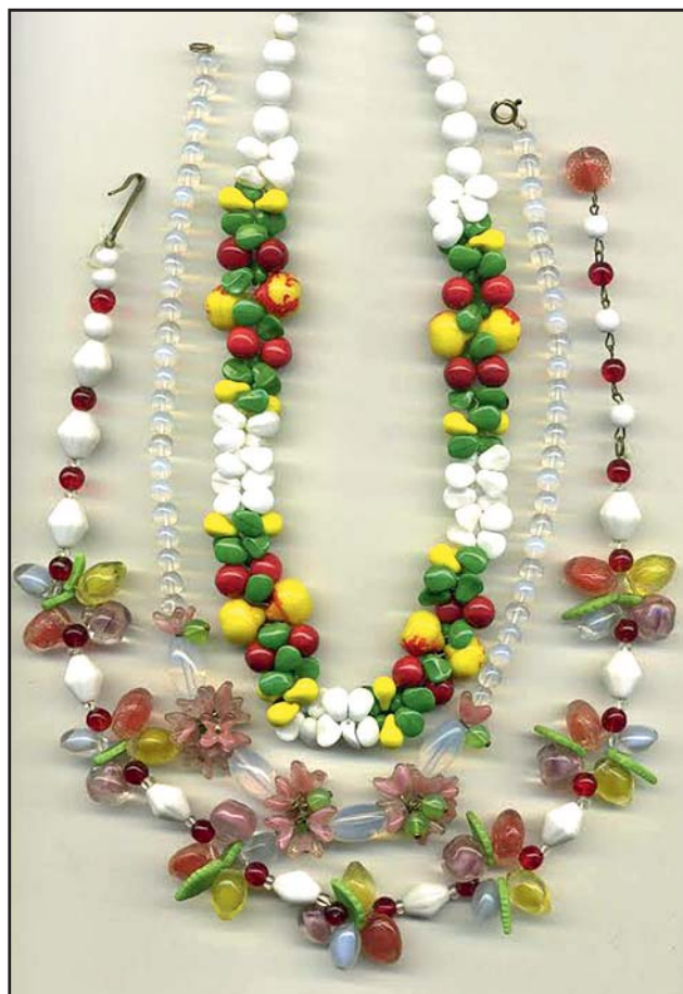
97. Бусы «фруктовый салат»

Брошь «листок». Стекло, металл. Размеры 7x3,5. 1950-1960-е гг.