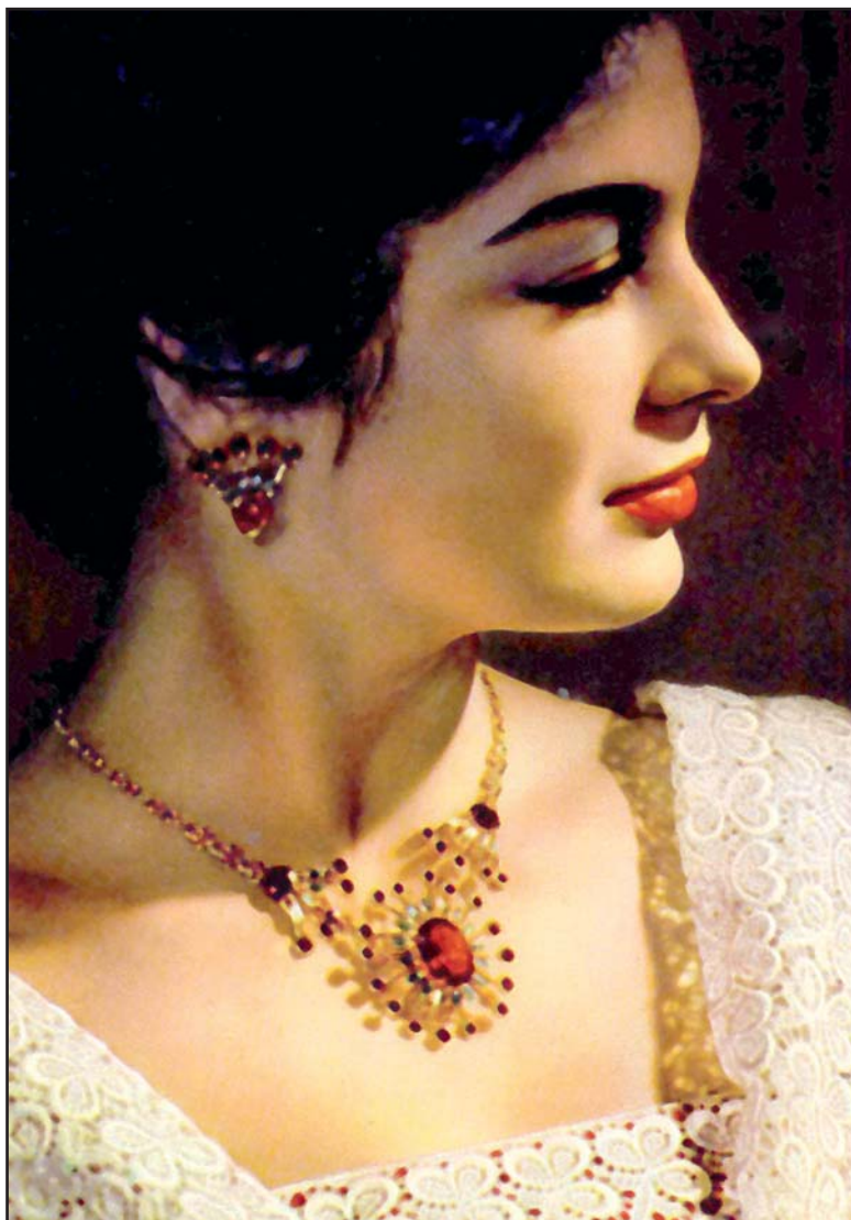
95. Реклама изделий Яблонекса, 1960-е гг.

В Москве в конце 1950-х прошла выставка чешского стекла (илл. 95), оно появилось в магазинах, и перед советскими женщинами впервые открылся завораживающий мир чеш-