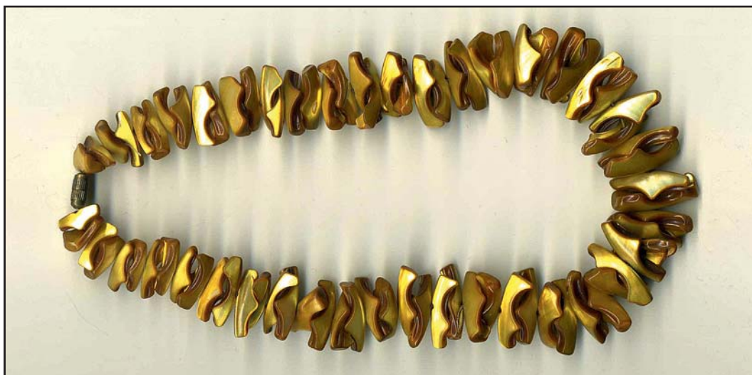
101. Бусы. Перламутр, покрытый золотистым лаком. Замок более поздний. 43,5. Чехословакия, 1958