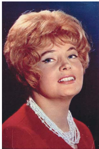
106а. Татьяна Доронина. Открытка, 1968