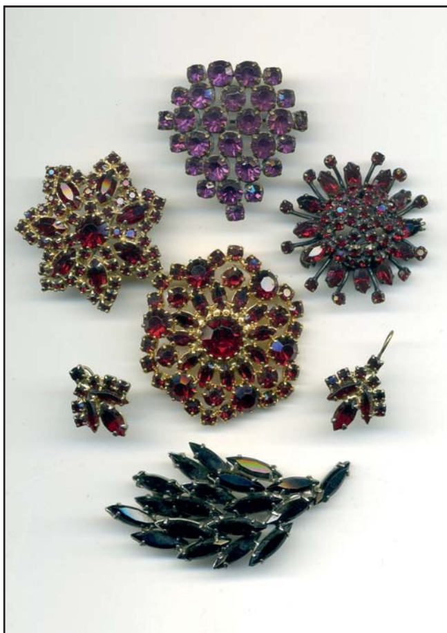
96. Украшения с имитацией гранатов. Чехословакия (сверху-вниз)

Брошь треугольная. Стекло, металл. Размеры 4x4,5. 1930-1940-е гг.