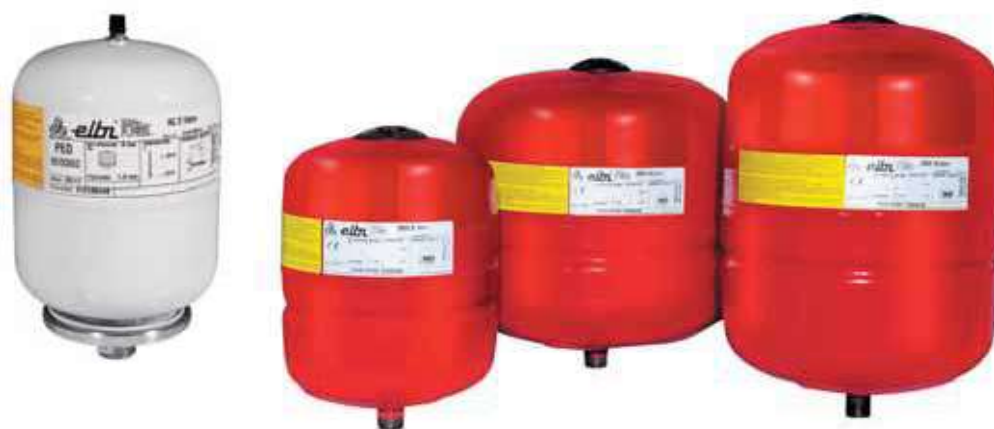
AC - 2

РАСШИРИТЕЛЬНЫЕ БАКИ С НЕСМЕННОЙ МЕМБРАНОЙ ДЛЯ ОТОПИТЕЛЬНЫХ СИСТЕМ (2 - 24 ЛИТРЫ)