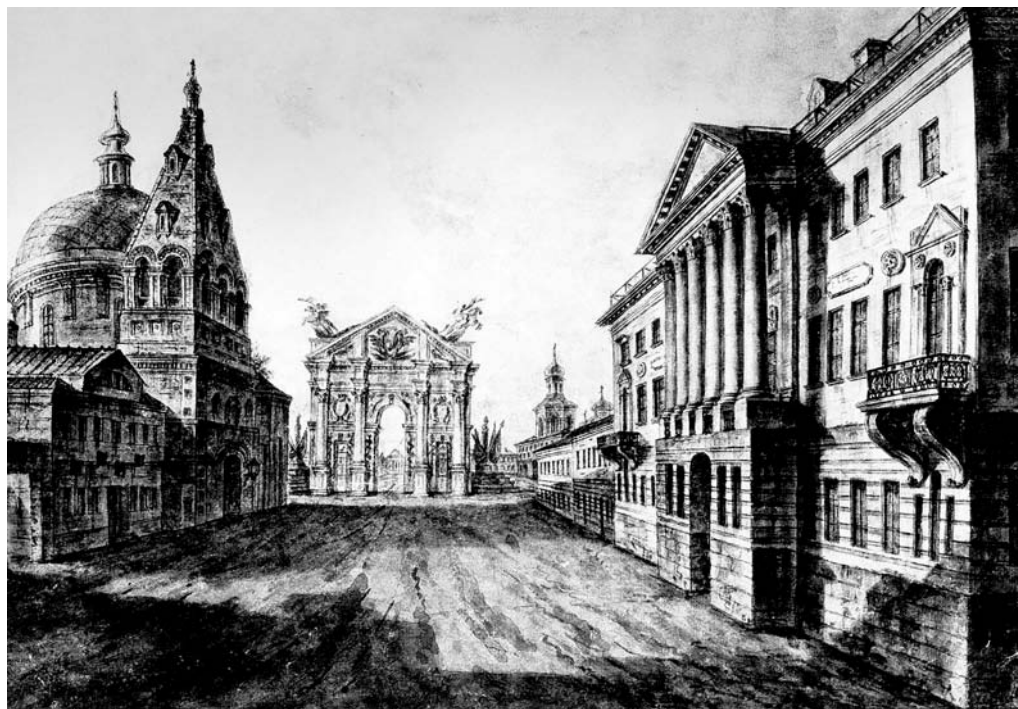
Дом Козицкой, слева — церковь Дмитрия Солунского. Худ. Ф. Алексеев, 1800