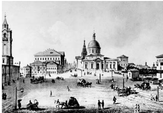
Вид на дом Козицкой со стороны Страстного монастыря. Худ. Шарлемань, сер. XIX века

В 1820-е годы, по словам Петра Вяземского, «в Москве дом княгини Зинаиды Волконской был изящным сборным местом всех замечательных и отборных личностей современного общества». Одну из таких замечательных личностей провожали здесь зимним вечером 26 декабря 1826 года в Сибирь. Мария Николаевна Волконская покидала Москву и уезжала вслед за мужем — декабристом С.Г. Волконским, приговоренным к ссылке (кстати, братом мужа Зинаиды Волконской Никиты Волконского). Пушкин не мог не прийти попрощаться. Ведь Марию Волконскую он знал, еще когда она носила девичью фамилию Раевская. Поэт сблизился с семьей Раевских во время их путешествия на Кавказ и в Крым. Марию Волконскую принято называть «утаенной любовью» Пушкина, а с именем ее связывают стихотворения «Редет облаков летучая гряда» (1820), «Таврида» (1822), «Ненастный день потух» (1824), «Буря» («Ты видел деву на скале», 1825), «Не пой, красавица, при мне» (1828), «На холмах Грузии» (1829).