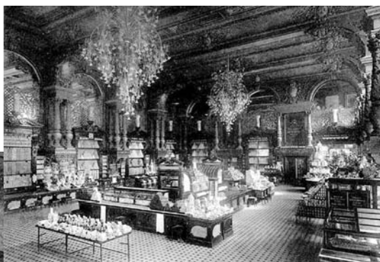
Внутренний вид магазина