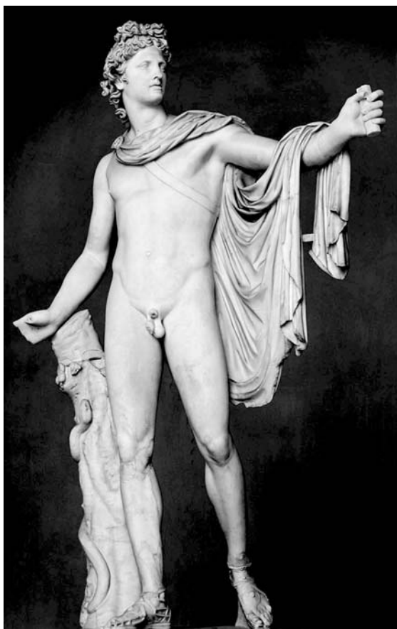
Тот самый Аполлон Бельведерский

А незадачливый поэт, который, быть может, и останется в истории литературы как человек, удостоившийся пушкинской эпиграммы, поспешил ответить стихотворением «Ответ Хлопушкину»: