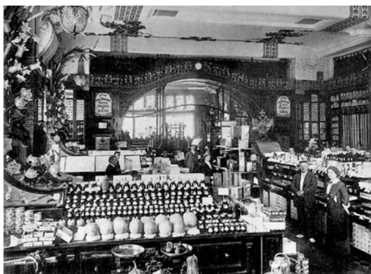
Отдел колониально- гастрономических товаров