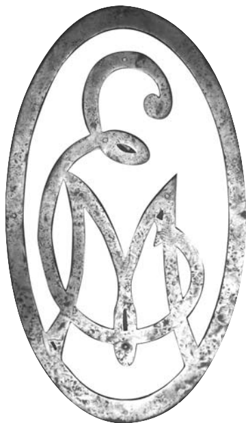
Торговая марка Елисеевского магазина