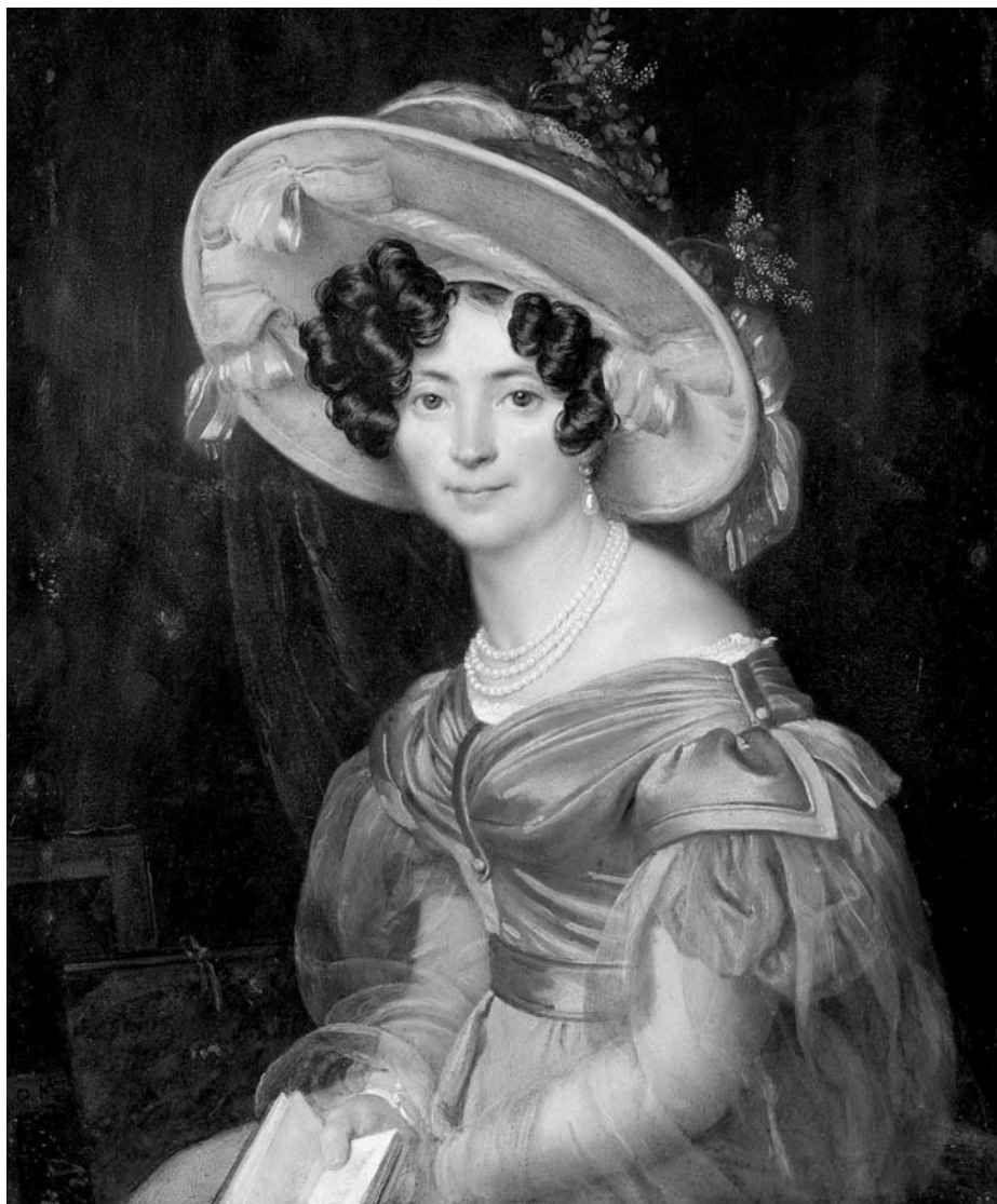
Зинаида Волконская. Фрагмент портрета О. Кипренского, 1830

(влюбленный в хозяйку живописец изобразил ее на своей картине «Милосердие»). Общение с яркими представителями русской культуры вызвало у Волконской жгучий интерес к русскому искусству и к самой России как объекту европейского культурного влияния.