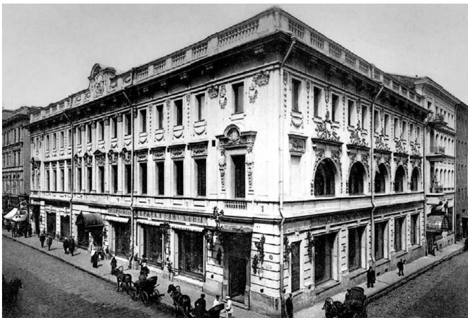
Елисеевский магазин после открытия

Можно было и не ходить к Елисеевым за вином, но не знать об их разнообразии было нельзя. Именно миллионер Григорий Елисеев и открыл на Тверской летом 1901 года большой гастроном для продажи перечисленных вин и деликатесов — «Магазин Елисеева и погреба русских и иностранных вин». В нем имелось пять отделов: колониально-гастрономических товаров, хрусталя Баккара, бакалейный, кондитерский, фруктовый, копильные и засолочные цеха, а также своя пекарня, выпекавшая вкуснейшие пирожные. Такой же магазин открыли и в Санкт-Петербурге на Невском проспекте, а затем и в Киеве. У Елисеева можно было встретить и хорошо одетого господина, и простолюдина, ибо магазины предназначались не только для богатого сословия, и дня не способного протянуть без оливок и анчоусов, но и для народа попроще, приходящего сюда за хлебом и молоком.