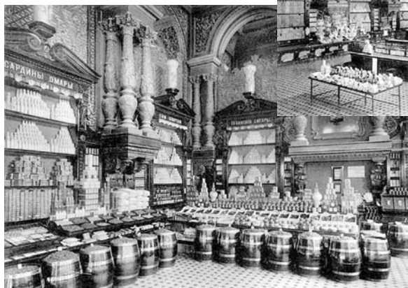
Бакалейный отдел магазина