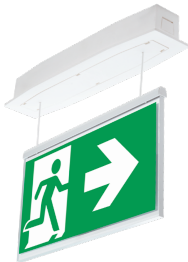
Suprema D zainstalowana jako PT-S / recessed mounting with sus- pended light guide plate PT-S