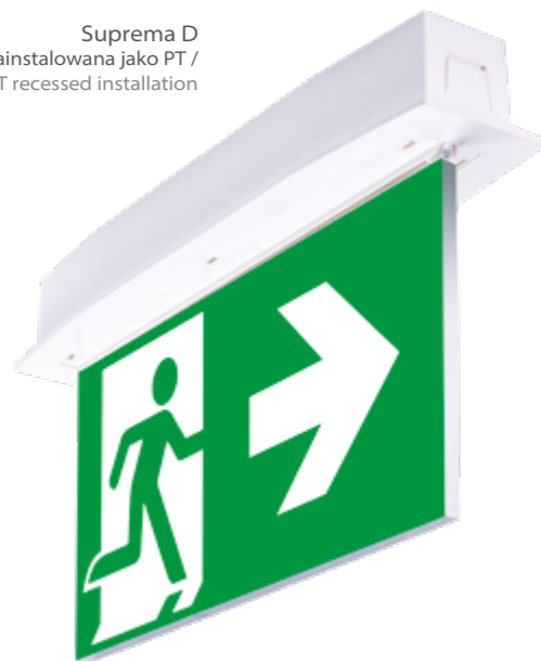
Suprema D zainstalowana jako PT / PT recessed installation