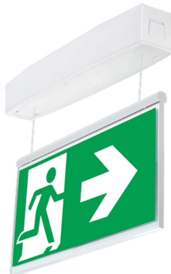
Suprema D zainstalowana jako NT-S / surface mounting with suspended light guide plate NT-S